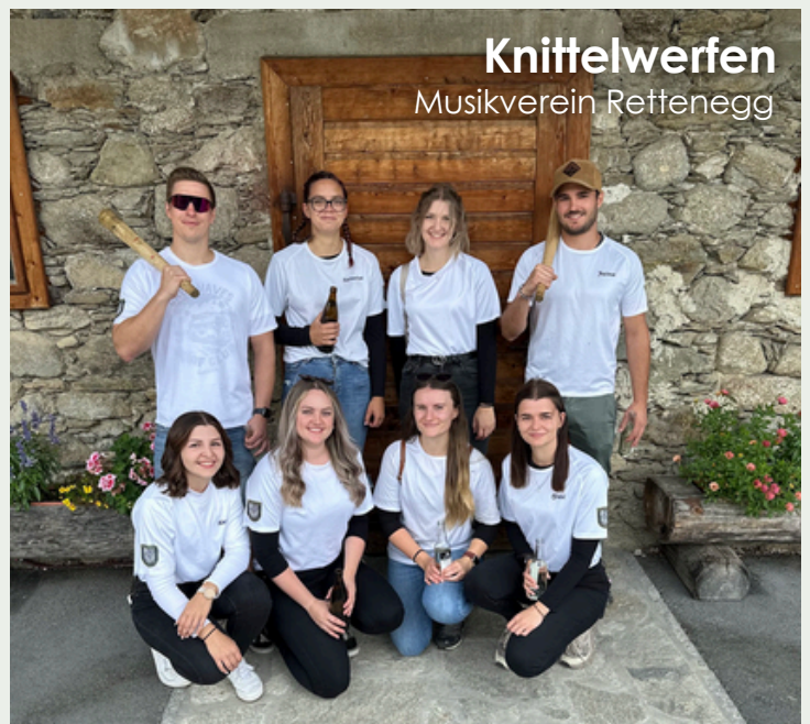
Knittelwerfen Musikverein Retteneegg