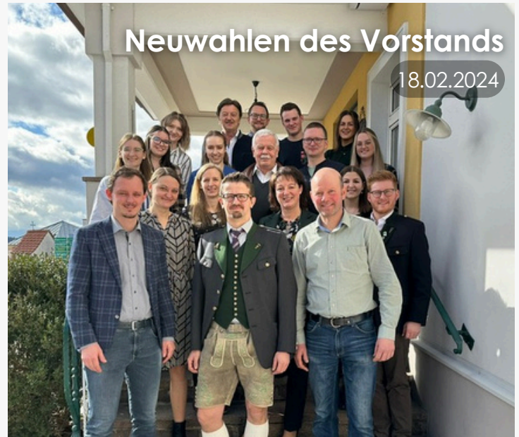
Neuwahlen des Vorstands