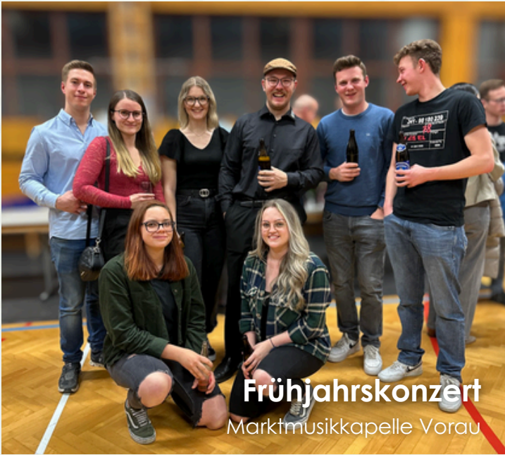
Frühjahrskonzert Marktmusikkapelle Vorau