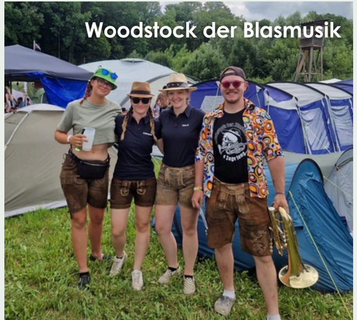
Woodstock der Blasmusik