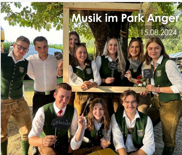
Musik im Park Anger