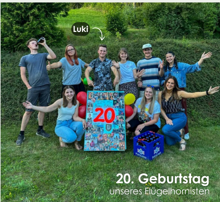
20. Geburtstag unseres Flügelhornisten