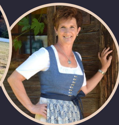
MODERATION: Elfi Groß