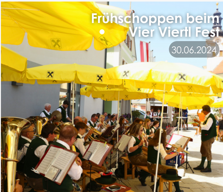
Frühschoppen beim • Vier Viertel Fest