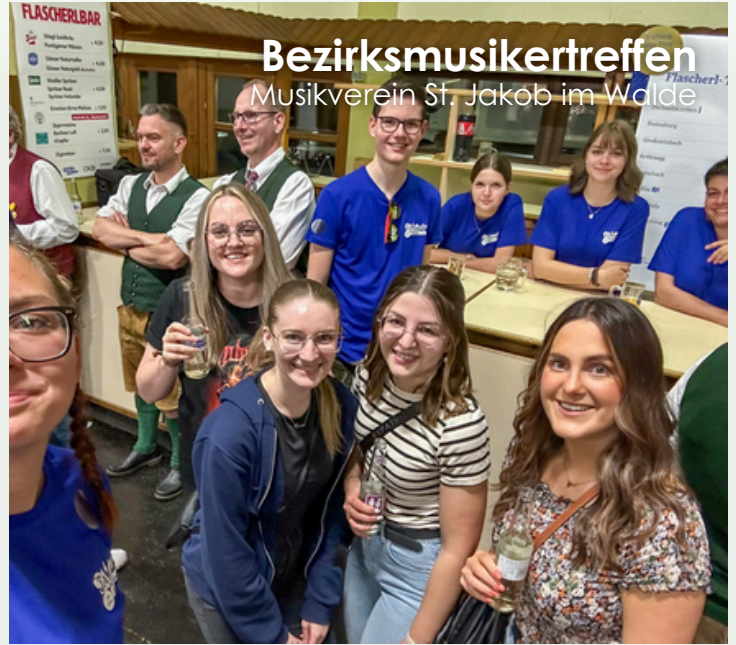
Bezirksmusikertreffen Musikverein St. Jakob im Walde